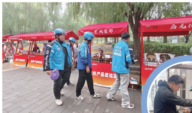
▲ 小哥参加在庆丰公园举办的朝阳区第六届社区邻里节