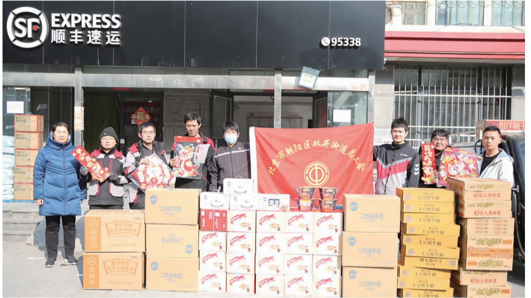
双井街道慰问新就业群体