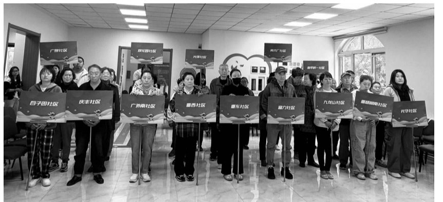
开幕式上残疾人代表举牌进场

沙包投掷盘环节上,选手们站在投掷线后,双脚稳稳扎地,双手紧握沙包,目光坚定地望向远处的投掷盘,身