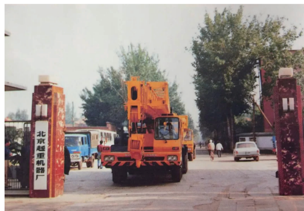
原北京起重机器厂

就拿双井西南角说吧:最早是双井大食堂。一溜整齐的平房,淡蓝色的门窗,一早就呈现热闹的场景,早起就有很多赶大车进城的把牲口拴好,停放在门口吃草,自己到里面吃自己喜爱的早点。炸油饼的,烙烧饼的,吆喝的,真是热闹非凡。这样的场面不知从什么时候开始变成了燕春楼,且越变越高档,平房变成了楼房。现在是佳龙大厦。