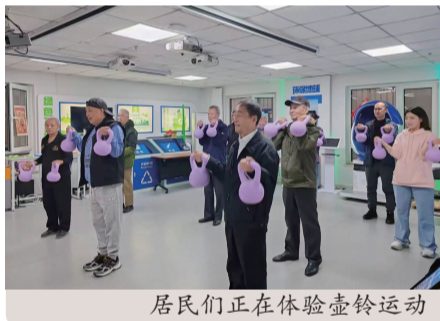
居民们正在体验壶铃运动