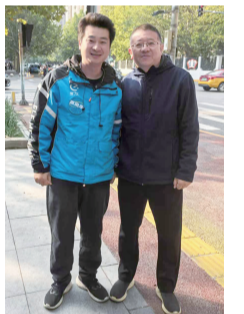
▲ 小哥在向社区书记传达社情民意

“小哥副楼长”利用工作之余的空闲时间,倾听传达社情民意,积极参与社区志愿服务,化身穿梭于街巷的温暖使者,为需要帮助的人伸出援手,让社区更加和谐宜居。