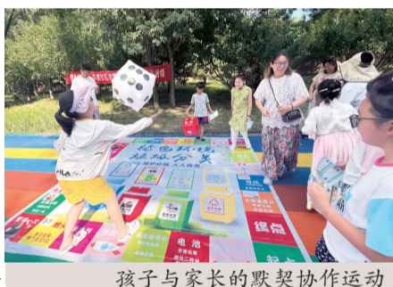
孩子与家长的默契协作运动