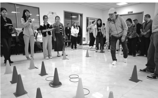
趣味套圈项目进行中

体微微后仰,然后猛然发力,将沙包高高抛出,稳稳地落在投掷盘中,旁边不时传来观众们的鼓励话语。