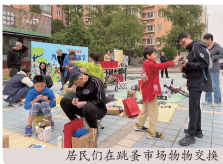
居民们在跳蚤市场物物交换

本次活动促进了邻里间的相互了解，增强了社区凝聚力。让居民愿关注、能感知、可参与，共同营造一个“邻里有爱 社区如家”的良好社会氛围。