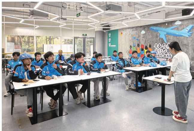
“小哥”参与技能培训课堂

在提供服务的同时,街道牵头建立美井骑士志愿服务队,动员“小哥”与社区围绕基层治理的问题,遇事共商、问题共答,丰富邻里服务内涵,让新就业群体成为基层治理的重要力量。今年4月21日,针对苹果小区内居民反映的绿地斑秃问题,饿了么“小哥”10余人参与社区绿地补种。盒马超市配送员化身文明引导员,融入群防群治,换位体验“出行文明”,提醒其他“小哥”规范出行。此外,双井街道还不断探索“小哥”在社会治理中的新角色,如开展消防宣传、反诈宣传等服务,“小哥”作为“消防协理员”“反诈宣传员”参与其中。