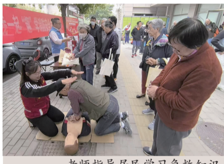
老师指导居民学习急救知识