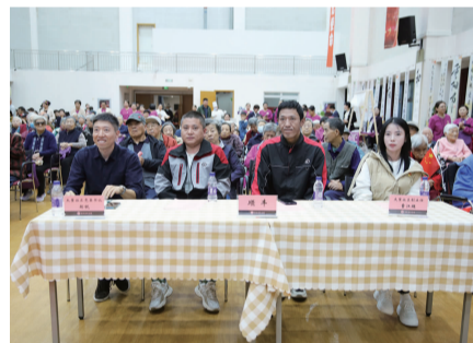
▲ “小哥”参与社区联欢活动

在面对社区工作时,作为“小哥副楼长”,这些“新”力量往往具有独特的“新”优势,比如他们无需培训,便已具备很强的沟通交流能力,也很善于倾听,不用刻意走街入户,便已对社区周边环境十分熟悉。