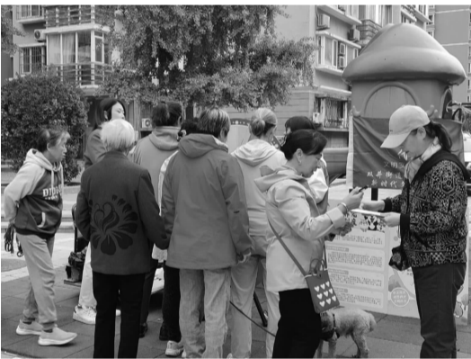
民警向居民发放文明养犬宣传手册

为引导居民依法养犬、文明养犬,有效加强社区养犬管理,营造安全有序的社区生活环境,10月16日上午,双井街道平安建设办公室联合九龙山社区举办文明养犬知识普及活动,进一步提升居民的文明养犬意识,减少不文明行为。