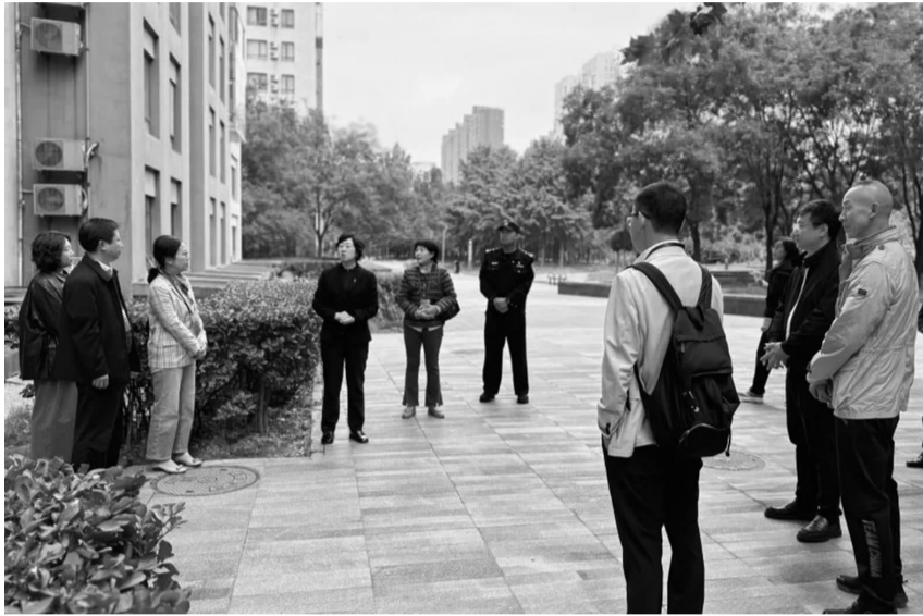
调研组现场普及文明养犬注意事项

调研组到达苹果社区南区,实地查看小区公共空间内安装的文明养犬标识牌,设置的宠物便箱等,相关部门向居民普及文明养犬注意事项及办理养犬登记等常识,讲解公共场所犬只随地便溺、不系狗绳、