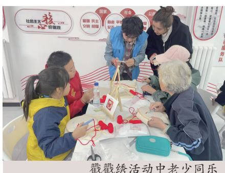
戳戳绣活动中老少同乐