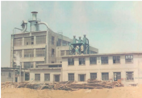
原双井光华木材厂