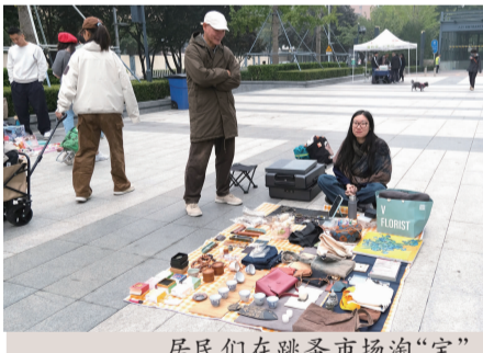
居民们在跳蚤市场淘“宝”