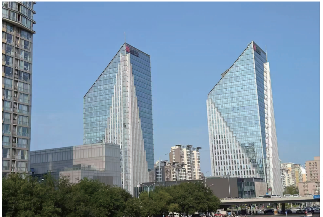
乐成双子塔

我两岁来到双井,可以说是土生土长的老双井人。从记事起就觉得双井是一个大地方。奔厂区来,就仿佛有了家的感觉。街边工厂林立,一家挨一家,了如指掌,如数家珍。往北有震山响的北京内燃机总厂,对面有三通,北齿;往西有重型,建机,光华,起重,轧辊;往东造纸厂,北汽,还有大大小小的街道工厂,真是数不胜数!