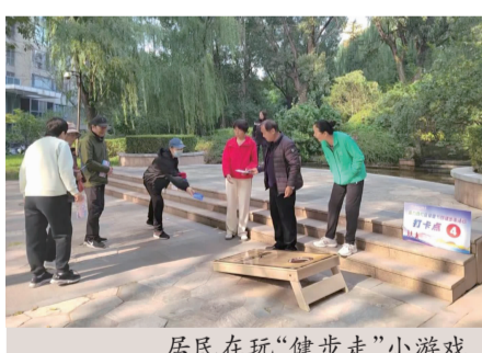
居民在玩“健步走”小游戏